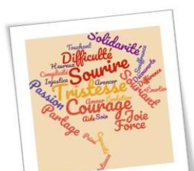
Lire le handicap autrement

A découvrir au CDI jusqu'au 18 février 2020 Ensemble scolaire Sacré Cœur Notre Dame